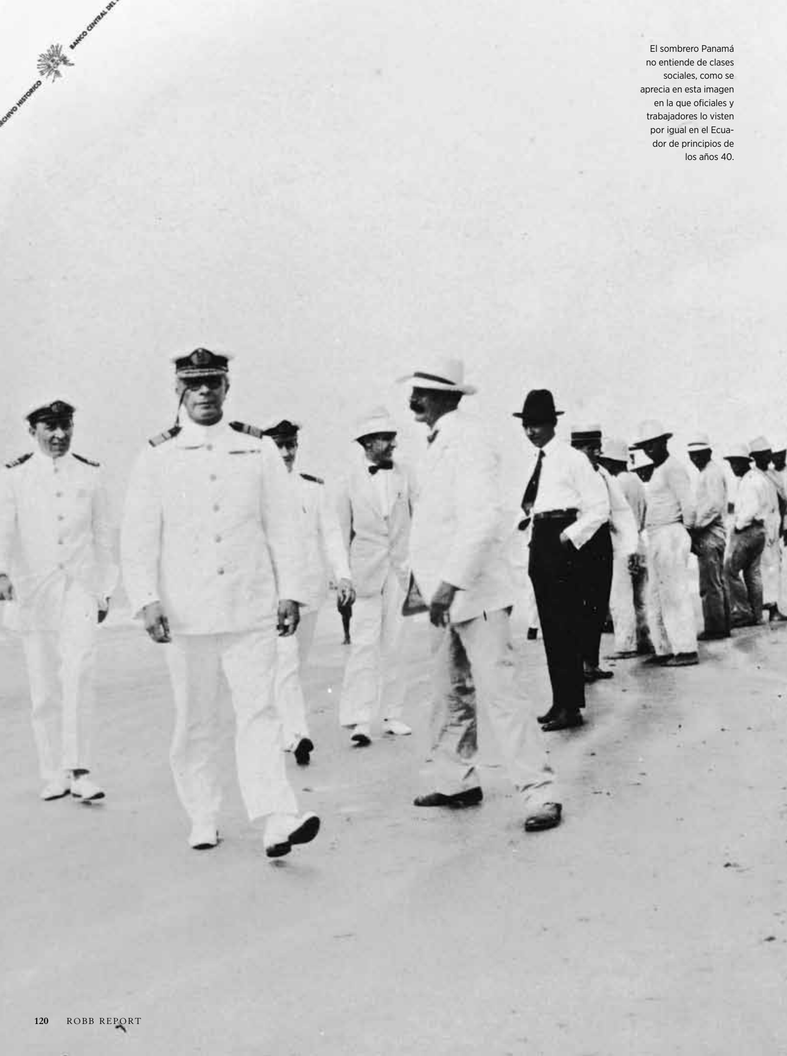
El sombrero Panamá no entiende de clases sociales, como se aprecia en esta imagen y en la que oficiales y trabajadores lo visten por igual en el Ecuador de principios de los años 40.